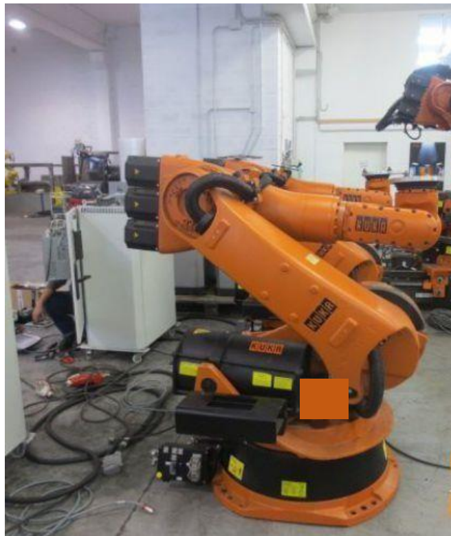
Figura 1: Braço mecânico kuka KR210 R2700 KRC2 ED05