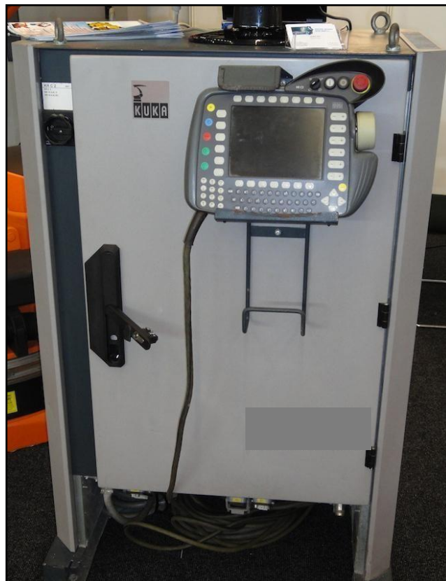
Figura 2: Painel elétrico de comandos Kuka KR210 R2700 KRC2 ED05

O robô Kuka KR210 R2700 KRC2 ED05 é composto de 3 partes distintas: Um braço mecânico capaz de realizar movimentos orbitais com 6 graus de liberdade conforme figura 1 com massa aproximada de 1300 kg, um painel elétrico de comando que comporta partes e componentes elétricos e eletrônicos conforme figura 2 com massa aproximada de 350 kg, total de 1650Kg, e um controle modelo krc2 para operação e programação conforme figura 3. Além de cabos de alimentação e de comandos.